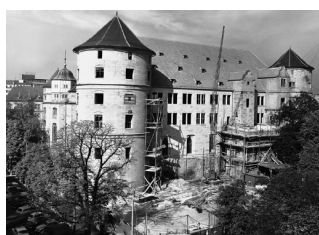
1965 beteiligte sich das Bauunternehmen am Wiederaufbau des Alten Schlosses Stuttgart.