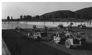
Ein Großprojekt für WOLFF & MÜLLER war 1953 der Ausbau des Stuttgarter Hafens.